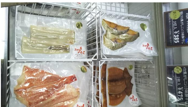
真空包装とソフト干物のシールを使用