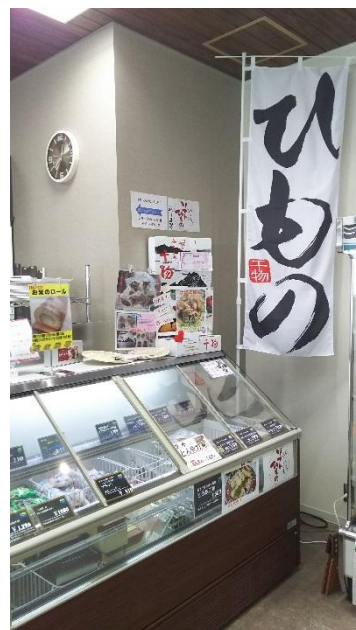
ひもの ノボリと冷凍ケース ヤマキ水産ソフト干物コーナー