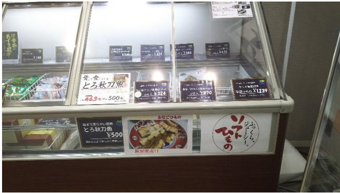
冷凍ケースにてソフト干物を販売