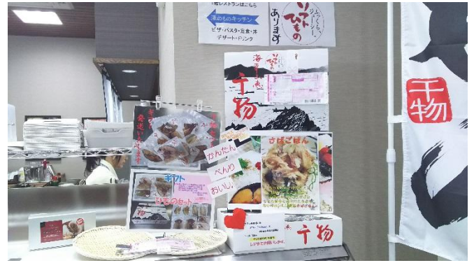
人気のギフトも注文受けの案内板